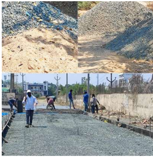
ప్రాంతాల్లో ప్రభుత్వ నిభందనలు మీకు పనులు చేసేవిధంగా చూడాలని మేధావులు కోరుతున్నారు.

నిర్మాణం సాగిస్తున్నట్లు తెలుస్తోంది.వివరాల్లోకి వెళితే రానుక్కుపల్లి పీజీ కళాశాల సమీపంలో ప్రభుత్వం దాదాపు 20 లక్షలతో సి.సి.రోడ్డు కు టెండర్లు పిలిచారు.నంద్యాలలో గతంలో మున్సిపాలిటీలో పని చేస్తున్న కాంట్రాక్టర్లకు డబ్బులు కోట్లాది రూపాయలు చెల్లించకపోవడంతో టెండర్ల పై ఆసక్తి చూపించలేదు.ఈ నేపథ్యంలోనే కర్నూల్ కు చెందిన ఒక కాంట్రాక్టర్ టెండర్ దక్కించుకొని పనులు మొదలు పెట్టారు.సి.సి.రోడ్డు వేసే ముందు ఆ రోడ్డు వరుసు చేసి ఒక రెవెల్ కు తీసుకొని రావాల్సి.రోడ్డు రెవెల్ అయినా తర్వాత వెట్ మిక్స్ వేసి దాదాపు 15 రోజులు రోల్డ్ తో తిప్పాల్సివుంది.బాగా చదును అయినా తర్వాత ప్రభుత్వ నిభందనలు మేర కంకర,ఇసుక,సిమెంట్ కలిపి సి.సి.రోడ్డు వేస్తారు.ఇక్కడ వెట్ మిక్స్ చేసి పట్టుమని పదిరోజులు కూడా గడవక ముందే సి.సి.రోడ్డు వేయడంతో పలువురు విమర్శలు చేస్తున్నారు.గతంలో గుడ్ షెఫర్డ్ పాఠశాల వద్ద ప్రభుత్వ నిభందనలు పాటించకుండా రోడ్డు వేయడంతో ప్రస్తుతం ఆ రోడ్డు పగిలిపోయిన విషయం అందరికీ తెలిసిందే.అధికారులు ఇప్పటికైనా ఎక్కడైనా రోడ్డు,కాల్లులు నిర్మాణం చేపట్టే